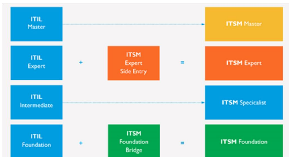
图 2: ITSM 认证体系与 ITIL® 认证体系的对应互认关系图